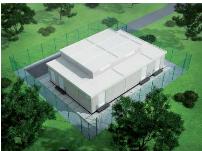
Рис. 5. Комплектная ПС 35/10(6) кВ системы EPDS «Дружба»

Применение унифицированных технических решений и поставка оборудования высокой степени заводской готовности позволяет ускорить проектирование, сократить расходы и продолжительность строительства, повысить надёжность и стабильность работы.