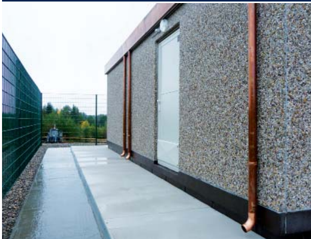
Рис. 1. Вариант реализации модульной продукции

Все модули изготавливаются в транспортных габаритах. Они доставляются на объект с помощью автотранспорта, монтируются и подключаются друг к другу с помощью специальной контактной системы на объекте строительства. Компактность модулей позволяет реконструировать или строить новые ком-