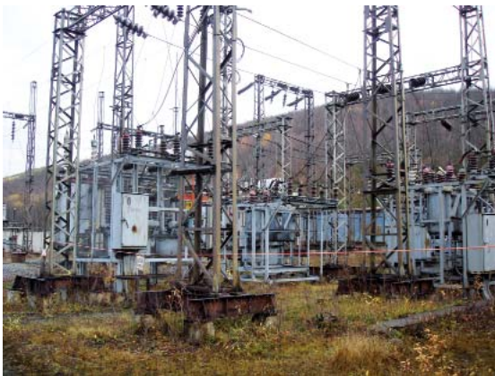
Рис. 3. Вид ПС 110/35/6 кВ № 57 «Колэнерго» до и после реконструкции

По данной технологии выполнены реконструкции ПС 110/10 кВ № 69 и ПС 110/35/6 кВ № 57 в «Колэнерго». Ниже представлен пример одной из них (рис. 3).